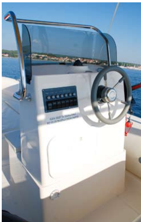
▲ Inoks okvir oko vjetrobrana služi i kao rukohvat