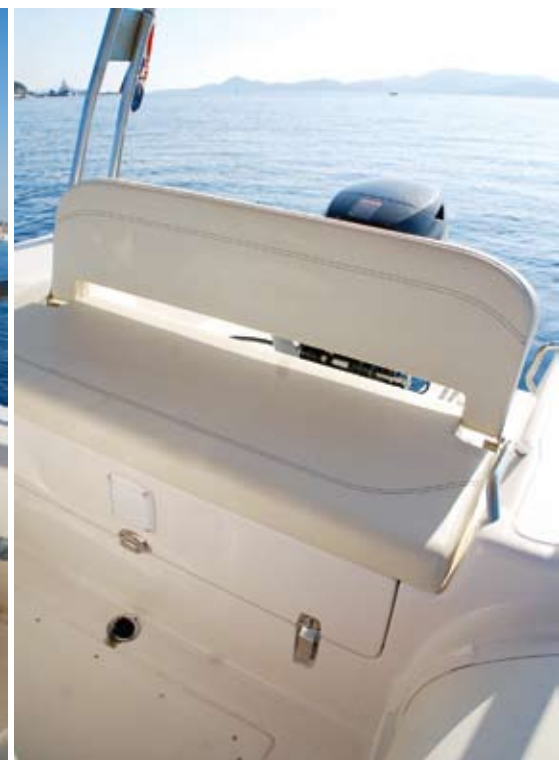
▲ Skiperska klupa je ujedno i krmena klupa za dvije osobe