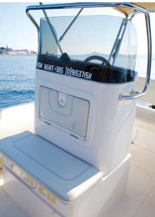
▲ Klupa ispred konzole danas je neizostavna na modernim gumenjacima