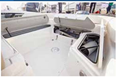
Krmeni spremnici su međusobno spojeni