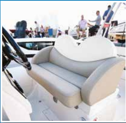
Prekloпно sjedalo za dvoje