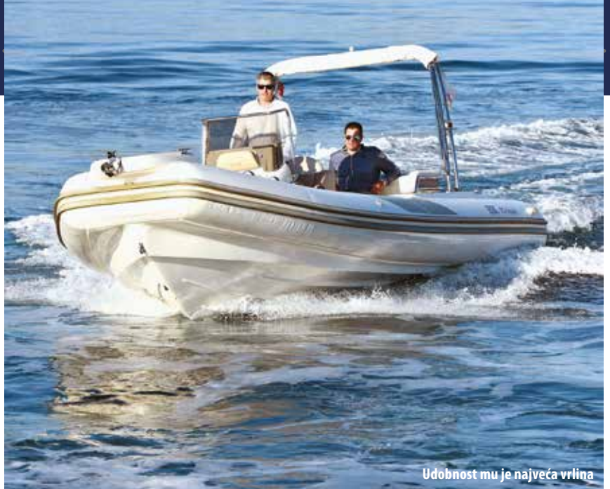
Udobnost mu je najveća vrлина

Položaj ručice gasa Uski prolaz kraj konzole