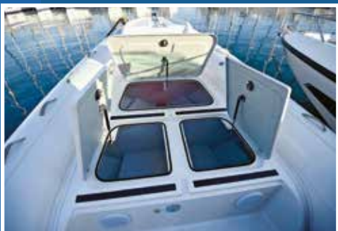
Pod sunčalištem su tri velika spremnika