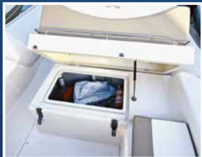
Svi pretinci imaju amortizere