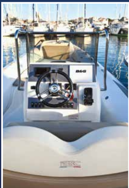
Konzolom dominira sportski volan

U proteklih desetak godina, koliko ih pratimo na domaćem tržištu, broj dostupnih modela talijanskih gumenjaka BSC Colzani se popeo na čak 30. Talijani su u 28 godina postojanja očito shvatili kako se učinkovito prilagoditi različitim profilima kupaca pa su široku flotu dizajnirali u šest različitih kategorija ( Classic, Sport, Ocean, Open, Charter i Tender ). Razlike među pojedinim paketima opreme nisu velike, ali dovoljne su da pogode cilj. Hrvatsko tržište orijentirano iznajmljivanju najviše se drži provjerene klasike, udobne krme i pramčanog sunčališta što je glavna karakteristika linije Classic . Jedan od razloga popularnosti toga brenda je i cijena - testirani primjerak s Yamahom 250 košta 59 tisuća eura što za gumu od 7,80 metara dužine preko svega nije prevelik iznos.