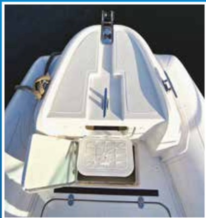
Veliko gazište na pramcu