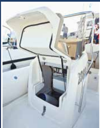
Uz konzolu je ostavljen uski prolaz