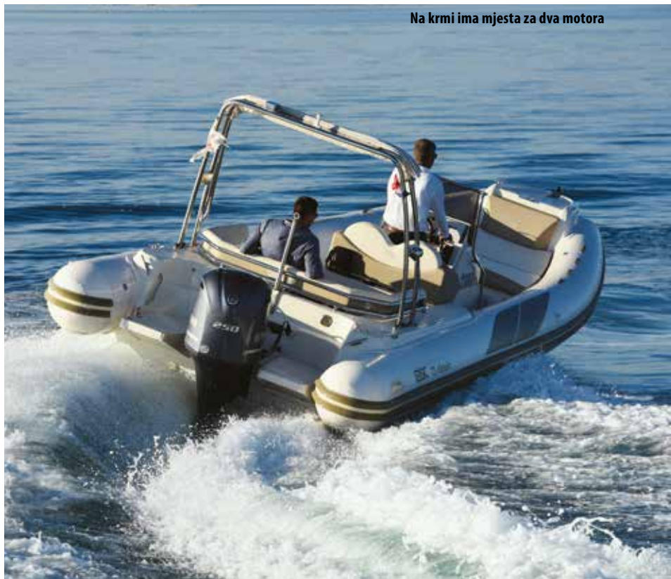
Na krmi ima mjesta za dva motora

s fiksnom upravljačkom klupom. Skiper bi onda mogao sjediti na desnom dijelu klupe dok sada mora biti u sredini prostora predviđenog za dvoje. I ručica gasa postavljena prenisko mogla bi se bolje složiti. Zapravo, glavni problem je u tome što je konzola s volanom na lijevoj strani dizajnirana za centralno upravljanje i svaka promjena u koncepciji otvara niz drugih stvari za riješiti.