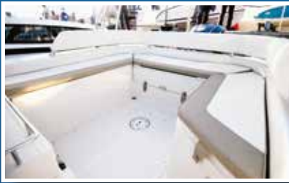
Krmeni kokpit ima udobni naslon